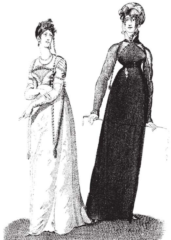
Susan J. Wolfson (Princeton and Oxford: Princeton University Press, 2000), págs. 256-7.

¿Viste aquellas tribus? No es suya la jactancia de plumas, / los feos ornamentos de un ejército desfilando / ... / Sino suyos son la luminosa mirada, el brazo vigoroso: / Suyo el rostro oscuro, de cálido ardor patriótico 31 .